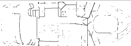
Plan d'aménagement Interior Layout Einrichtungsplan Plano de distribución

Porta a tre battenti accesso cockpit - Grande salone con divano a L a dritta e divano doppio a sinistra - Gavone sotto cucinerie - Fascia laterale completa finitura capitonné - Tavolo del salone - Mobile a colonna a sinistra, con bar, mobiletto e spazio per inserimento tv - Finestratura panoramica - Tende sulle finestrate